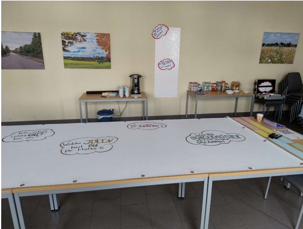
Abbildung 1 Plakat mit Fragen